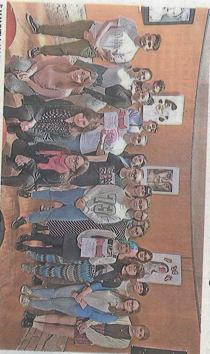
di MANUELA MARZIANI