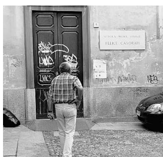
La succursale della media Casorati